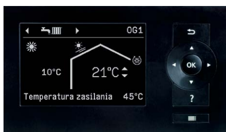
Wyświetlacz regulatora pompy ciepła Vitotronic 200