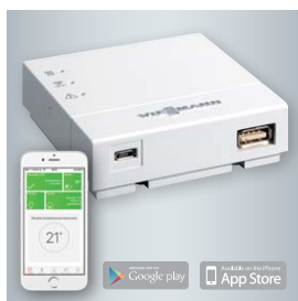
Moduł Vitoconnect 100 (w zakresie dostawy pompy ciepła) umożliwia zdalny nadzór i sterowanie instalacją grzewczą przez internet za pomocą aplikacji mobilnej ViCare.