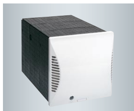
Kwadratowa tuleja ścienna z zewnętrzną osłoną ścienną

Kompaktowe urządzenie do wentylacji pomieszczeń Vitovent 200-D zostało zaprojektowane do kontrolowanej wentylacji (nawiew i wywiew) poszczególnych pomieszczeń. Napływające powietrze przechodzi przez filtry. Przez wbudowany krzyżowy przeciwprądowy wymiennik ciepła, powietrze napływające jest podgrzewane ciepłem pobieranym z powietrza pomieszczenia. Sprawność odzysku ciepła z powietrza wywiewanego dochodzi do 90 procent. Wymiana powietrza wynosi do 55 m 3 na godzinę. W przypadku zastosowania wielu urządzeń można realizować kompletne koncepcje wentylacji.