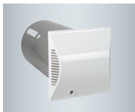
Okrągła tuleja ścienna z zewnętrzną osłoną ścienną