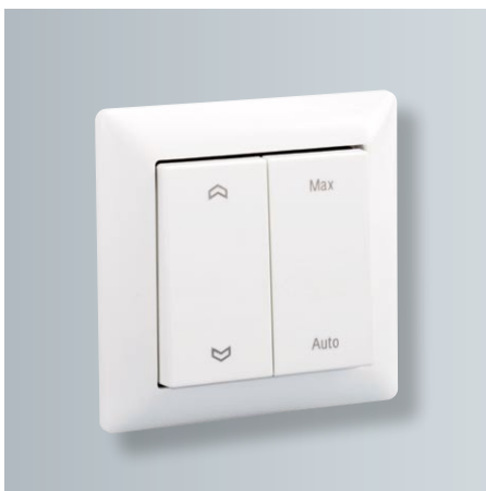
Estetyczny przełącznik bezprzewodowy (tylko razem z Vitovent 200-D, typ HRM A55)